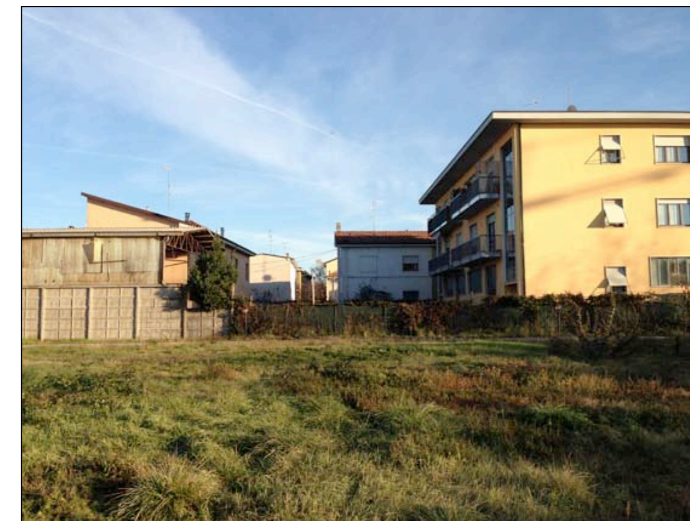
18 VISTA DA MAPPALE 198 VERSO PROPRIETA' CONFINANTI A EST