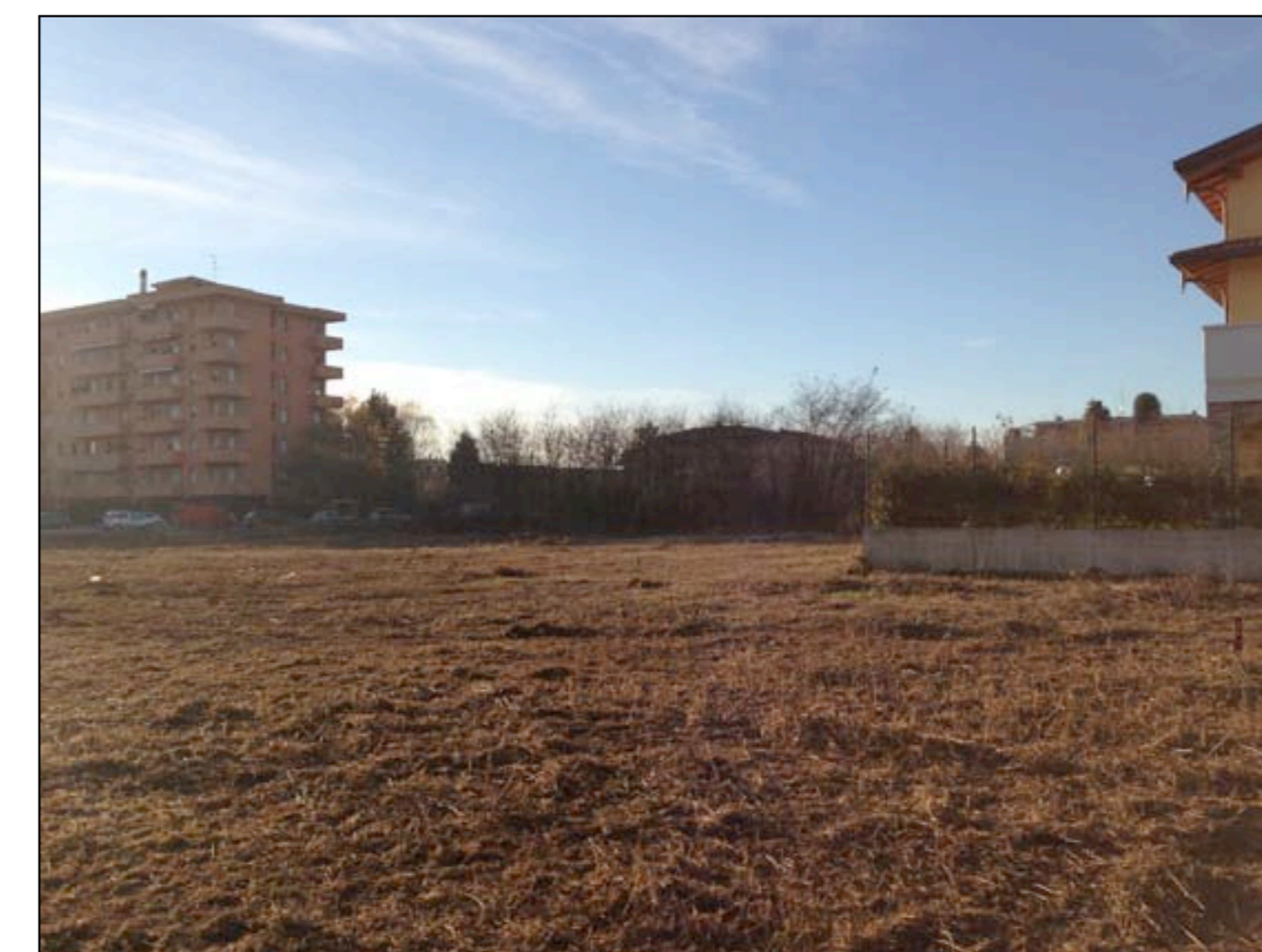
24 VISTA DA MAPPALE 69 VERSO VIA PIAVE