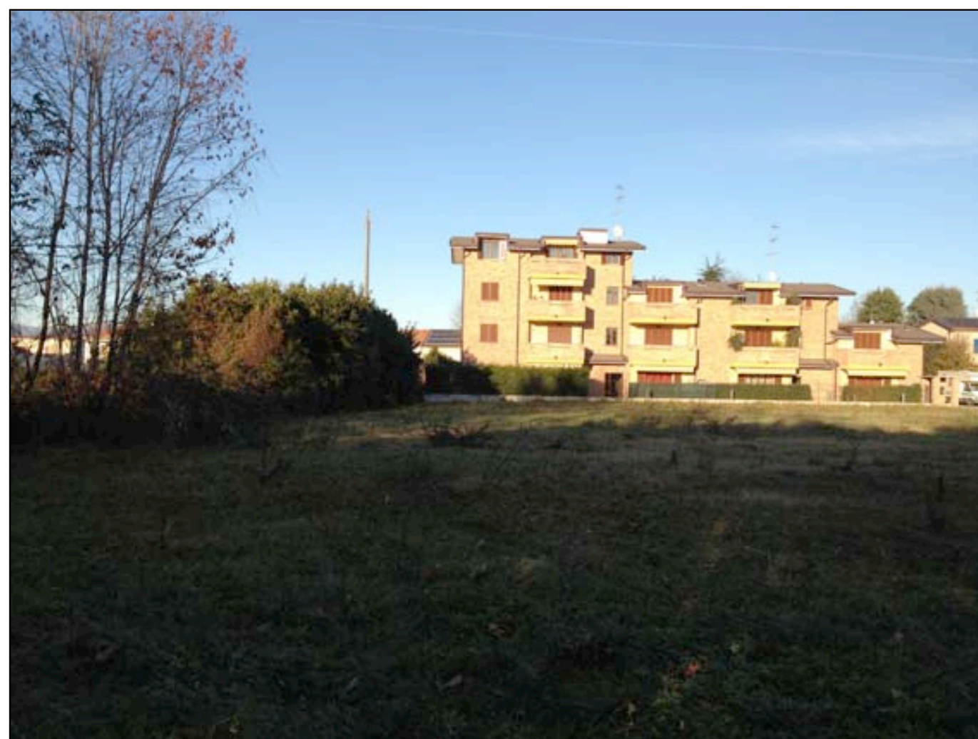
20 VISTA DA MAPPALE 198 VERSO EDIFICIO CONFINANTE A NORD