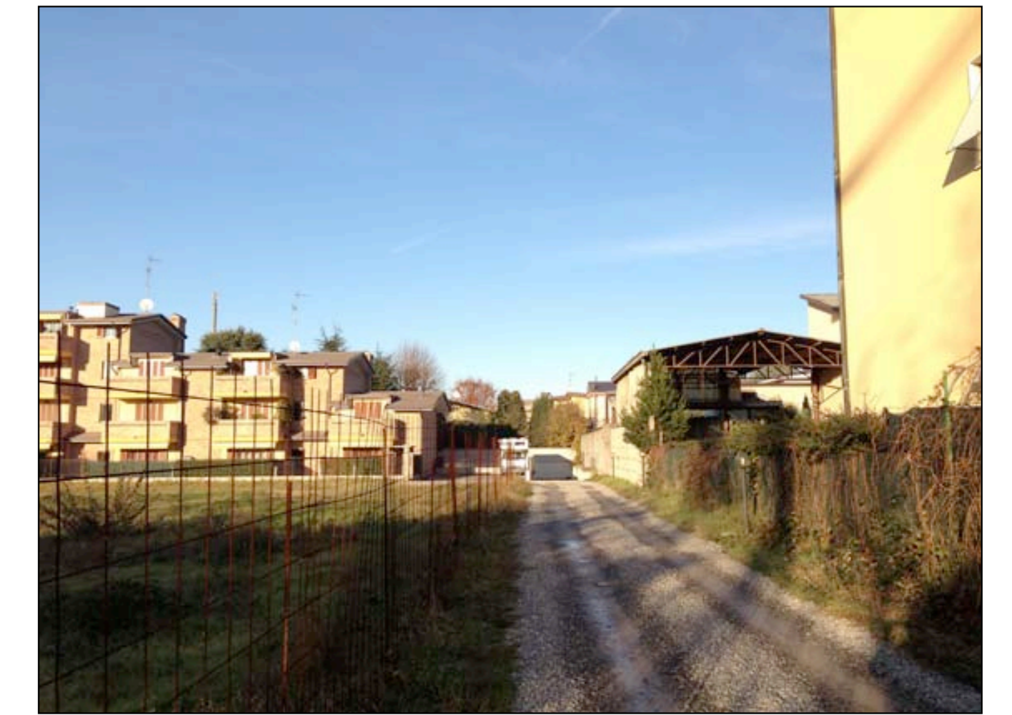
16 VISTA ACCESSO DA VIA PIAVE AD EST DELLE PROPRIETA'