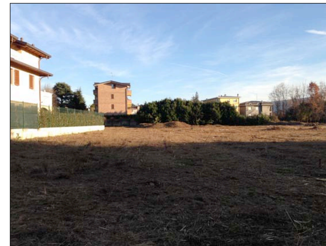
21 VISTA DA MAPPALE 66 VERSO EST