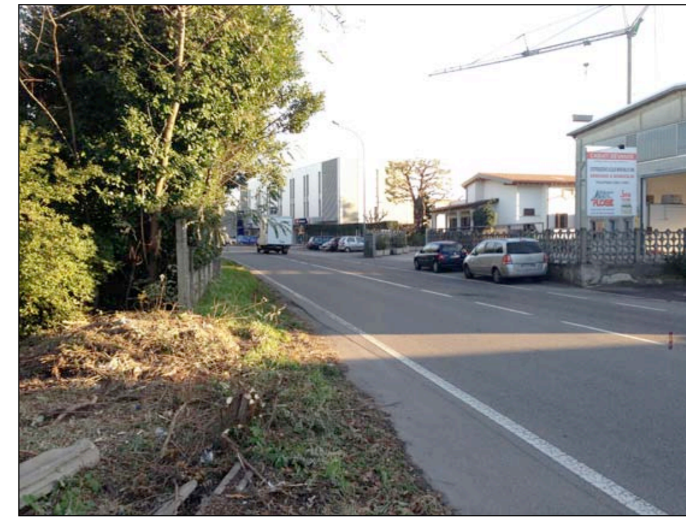
15 VISTA DA VIA PIAVE