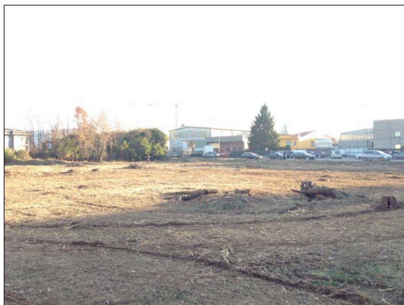
22 VISTA DA MAPPALE 66 VERSO VIA PIAVE