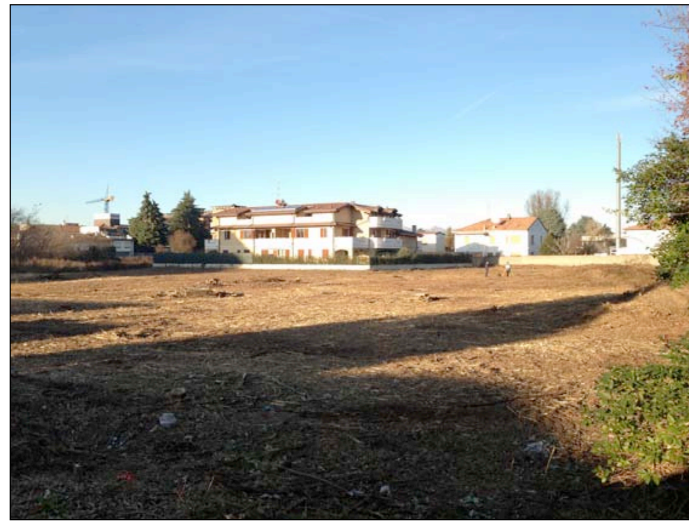
14 VISTA DA VIA PIAVE VERSO NORD-OVEST