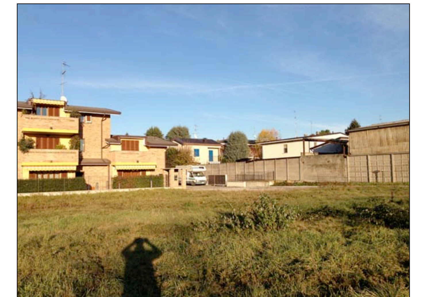
19 VISTA DA MAPPALE 198 VERSO PROPRIETA' CONFINANTI A NORD-EST