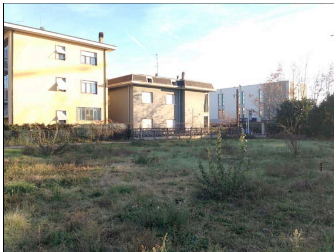
17 VISTA DA MAPPALE 198 VERSO ACCESSO DA VIA PIAVE