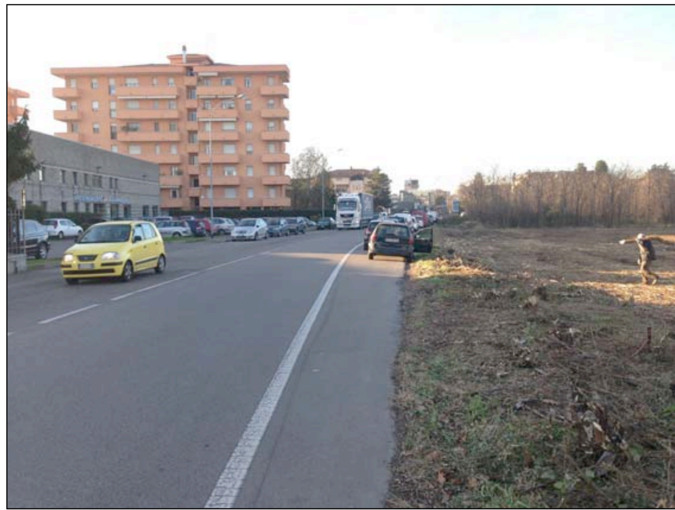
13 VISTA DA VIA PIAVE