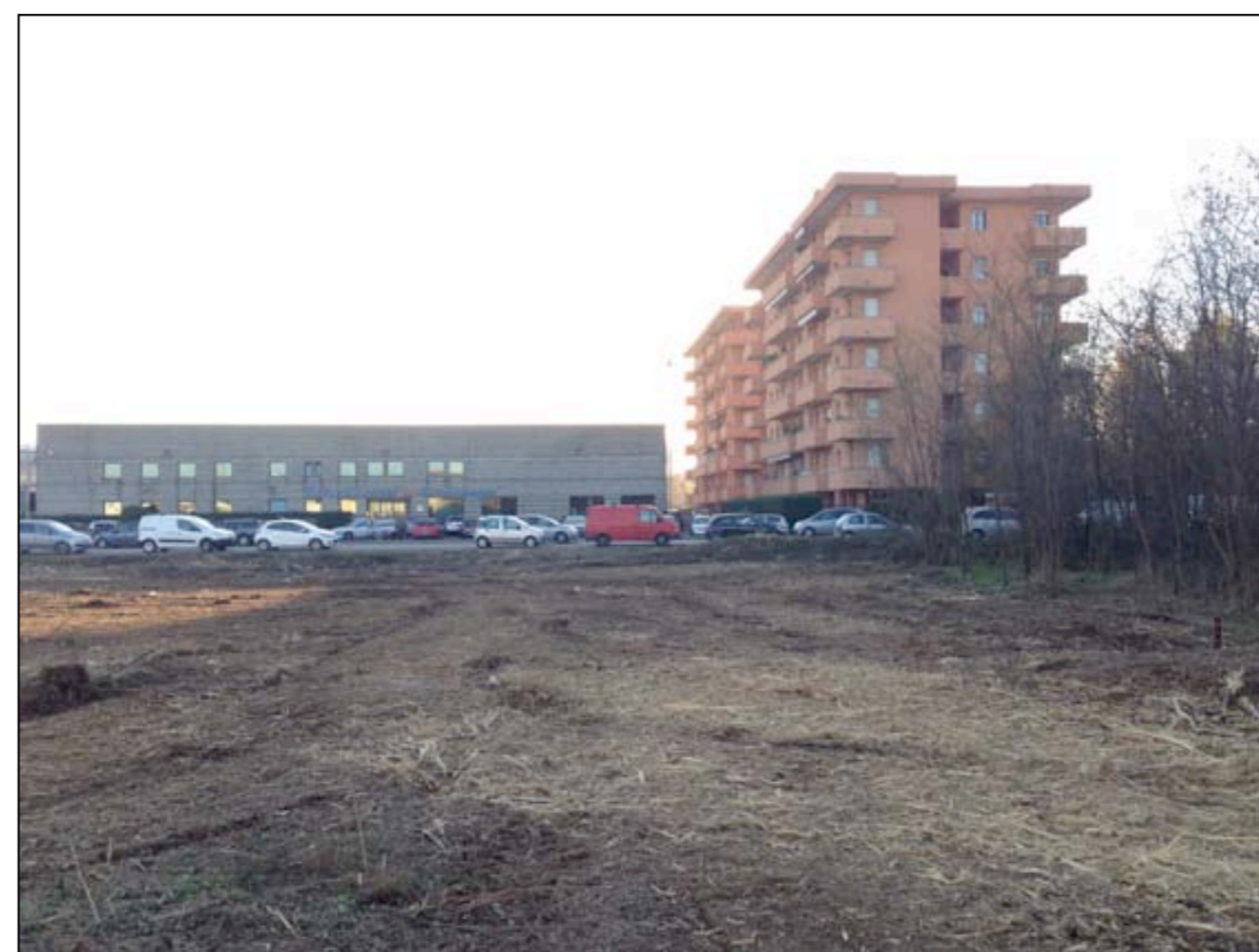
23 VISTA DA MAPPALE 66 VERSO VIA PIAVE