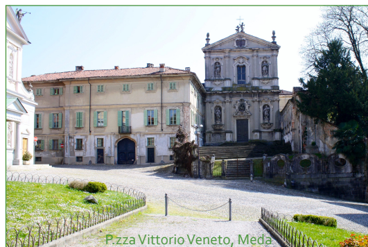
P.zza Vittorio Veneto, Meda