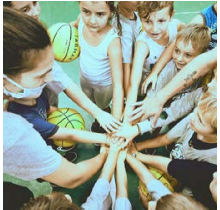
Piccoli cestisti crescono a Meda.

Iniziativa che sta avendo il riscontro di ottimi numeri: complessivamente, infatti, i bambini che svolgeranno le varie attività, gestite da istruttrici tesserate presso la Federazione Italiana Pallacanestro, saranno circa 500.