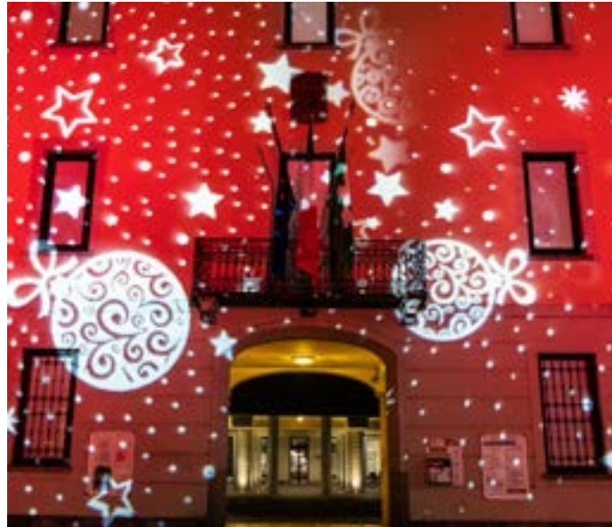
Luci natalizie rendono suggestivi molti angoli della città

Grazie all'impegno del Comune e delle Associazioni presenti sul territorio.