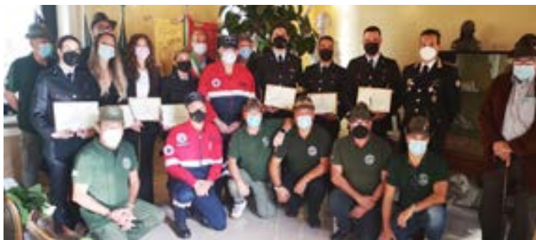
I volontari che si sono adoperati nel periodo dell'emergenza sanitaria

consentito, fra l'altro, di abbattere dell'80 per cento la Tari delle imprese più penalizzate, di erogare contributi economici straordinari e buoni spesa, il tutto per sostenere famiglie e imprese in difficoltà. Tornando al periodo più buio e difficile non possiamo dimenticare alcuni numeri riferiti al solo periodo marzo/maggio 2020: ad esempio, al reperimento e alla consegna casa per casa di 50.000 mascherine (oggi facilmente acquistabili, allora assolutamente introvabili), alla consegna a domicilio ad anziani e persone fragili di 7.000 pasti, alle oltre 1.000 telefonate in risposta a richieste di informazioni e di aiuto, agli oltre 6.000 servizi a favore di centinaia di persone in difficoltà, ai contagiati in isolamento o in quarantena, alle persone anziane e sole, alla consegna di farmaci e delle spe-