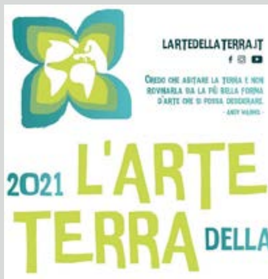
La locandina dell'evento "L'Arte della Terra" 2021

L'Arte della Terra ha così sfiorato i 600 voti con una proposta di spettacoli per adulti e bambini. Fra i futuri protagonisti, le compagnie teatrali Nido di Ragno, Erranti Teatro, A.T.I.R., Choròs Teatro, Compagnie Stradevarie, Arditoesio, Scarlattine Teatro, Il Trebbo, Musicamorfofi, Fare.