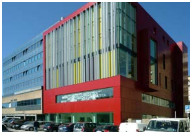
L'ingresso della Medateca. Nella pagina a destra: il logo di Artoteca una delle iniziative di Medateca

Gli orari della Medateca: chiusa nella giornata di lu-