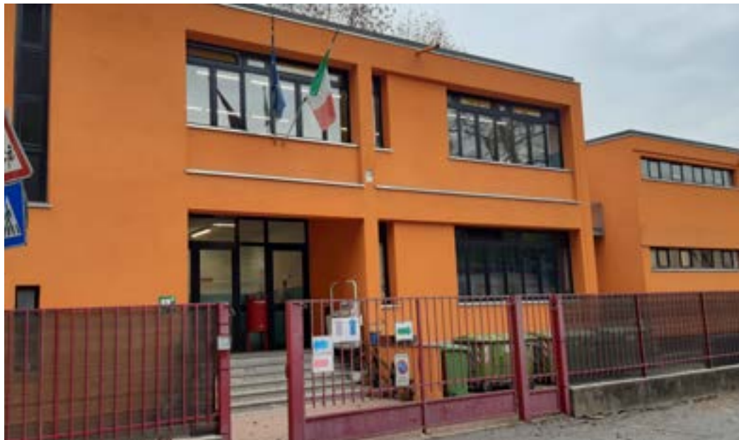
La scuola dell'Infanzia "Garibaldi" e, nella foto a destra, la scuola secondaria di 1° grado "Traversi"

Inoltre finanzia interventi e servizi a favore di alunni/e diversamente abili, co-finanzia progetti specifici inseriti nel PTOF (Piano Triennale dell'Offerta Formativa) finalizzati al potenziamento linguistico nelle scuole primarie e secondarie di 1° grado, laboratori di studio assistito con interventi rivolti ad alunni in situazione di disa-