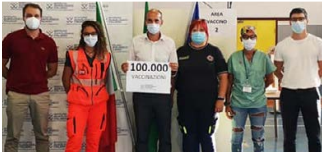
Sindaco e volontari nel giorno in cui è stata somministrata la 100.000 dose vaccinale

A partire dal 17 dicembre è attivo a Meda il nuovo Centro Vaccinale di Auxologico presso la sua vecchia sede di Corso della Resistenza. A regime saranno quattro le linee vaccinali, aperte dal lunedì al sabato, dalle ore 8 alle ore 20 ma non è escluso che si possa ampliare l'offerta. Il Centro Vaccinale è coordinato ed